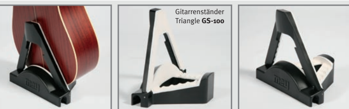
Gitarrenständer Triangle GS-100